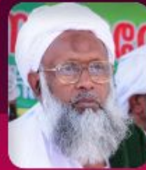
MT ABDULLA MUSLIYAR