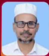
MP ABDURAHMAN MASTER